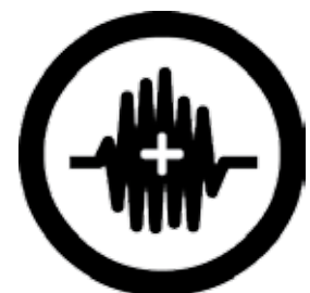
Sampling plus logo