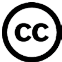
CC logo circle